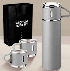
Termo 500 ML. +3 Tazas

CÓD: 20009521 | STOCK: 100 UDS. DISPONIBLE EN LIMA