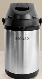
Termo Record Familiar 3.0 Lt.

Mantén tus bebidas calientes por más tiempo