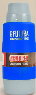
Termo One Nice 1.8 Lt.

CÓD: 20006521 | STOCK: 100 UDS. DISPONIBLE A NIVEL NACIONAL