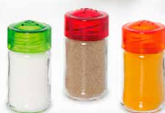
KERO HEREVIN COD.: 20008009