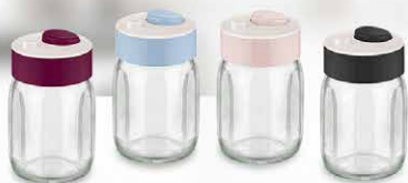
QUELLA BAGER COD.: 20008007