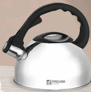
Tetera de Acero Inoxidable 2.5 Lt.

CÓD: 20009540 | STOCK: 100 UDS. DISPONIBLE EN LIMA